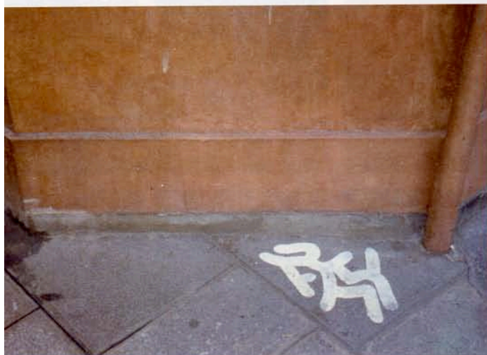
SO.6 / PARIS, LE MARAIS

GÉOSTRATÉGIE. L'art à ses adeptes et ses quartiers de prédilection. Aussi, il est beaucoup plus commun d'apercevoir les personnages d'ANDRÉ et de ses convives entre les secteurs du Louvre et du Marais plutôt que dans le 16 e arrondissement (du moins au début). Car aucun emplacement n'est anodin. La ville est utilisée dans toute sa globalité et aucun support n'est négligé. L'œuvre se doit d'être vue par sa cible potentielle avant tout, et d'être reconnue