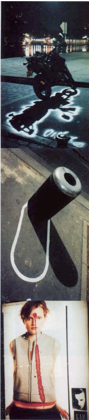
OMBRES ET CRIMES PUBLICITAIRES PAR ZEUS / PARIS