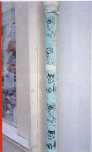
INCONNU / PARIS, LE MARAIS